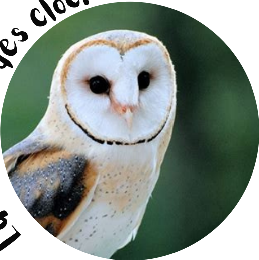
La chouette des clochers